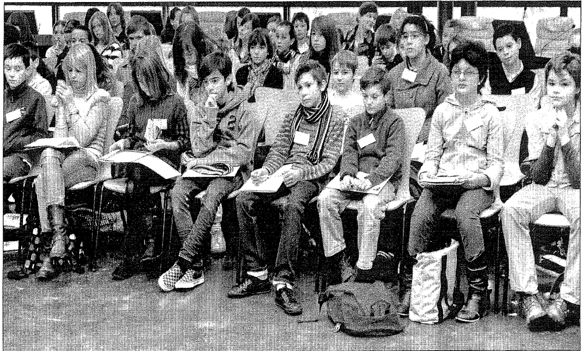
Les collégiens élus délégués poursuivent leur apprentissage de la citoyenneté au Conseil général.