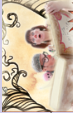
© Na C imagine - La Rafistolère

Spectacle itinérant dans 3 écoles maternelles de Longuyon et Pont-à-Mousson.